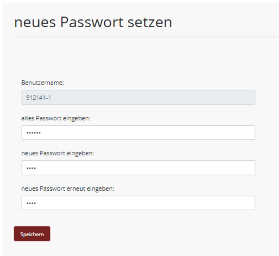
Abbildung 4: neues Passwort

Nachdem Sie sich erfolgreich anmelden konnten, erscheint eine neue Maske, in der Sie Ihr neues Passwort setzen müssen ( Hinweis : dieses Fenster erscheint nur beim allerersten Login):